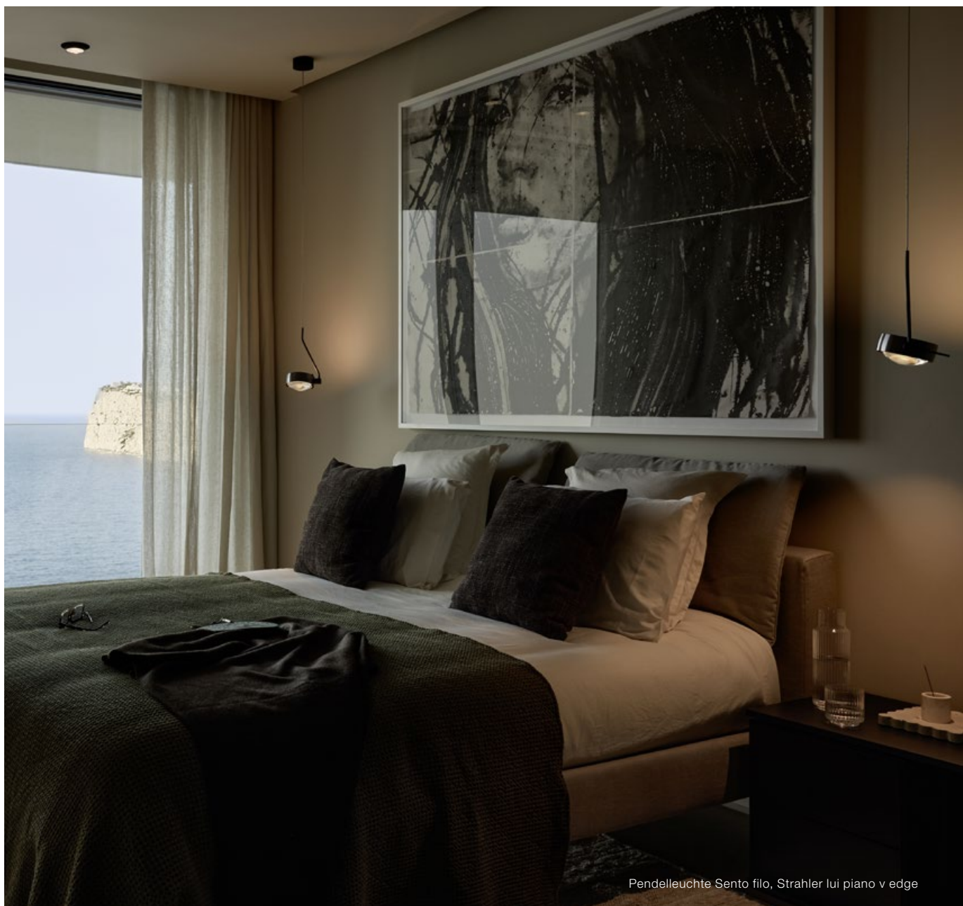
Pendelleuchte Sento filo, Strahler lui piano v edge

Während die Strahler lui piano v edge für eine harmonische Grundbeleuchtung sorgen, wird die Leuchte Sento filo im Bereich des Betthauptes zum Highlight – nicht nur in ästhetischer, sondern mit drehbarem Kopf und gerichtetem Licht auch in technischer Hinsicht.