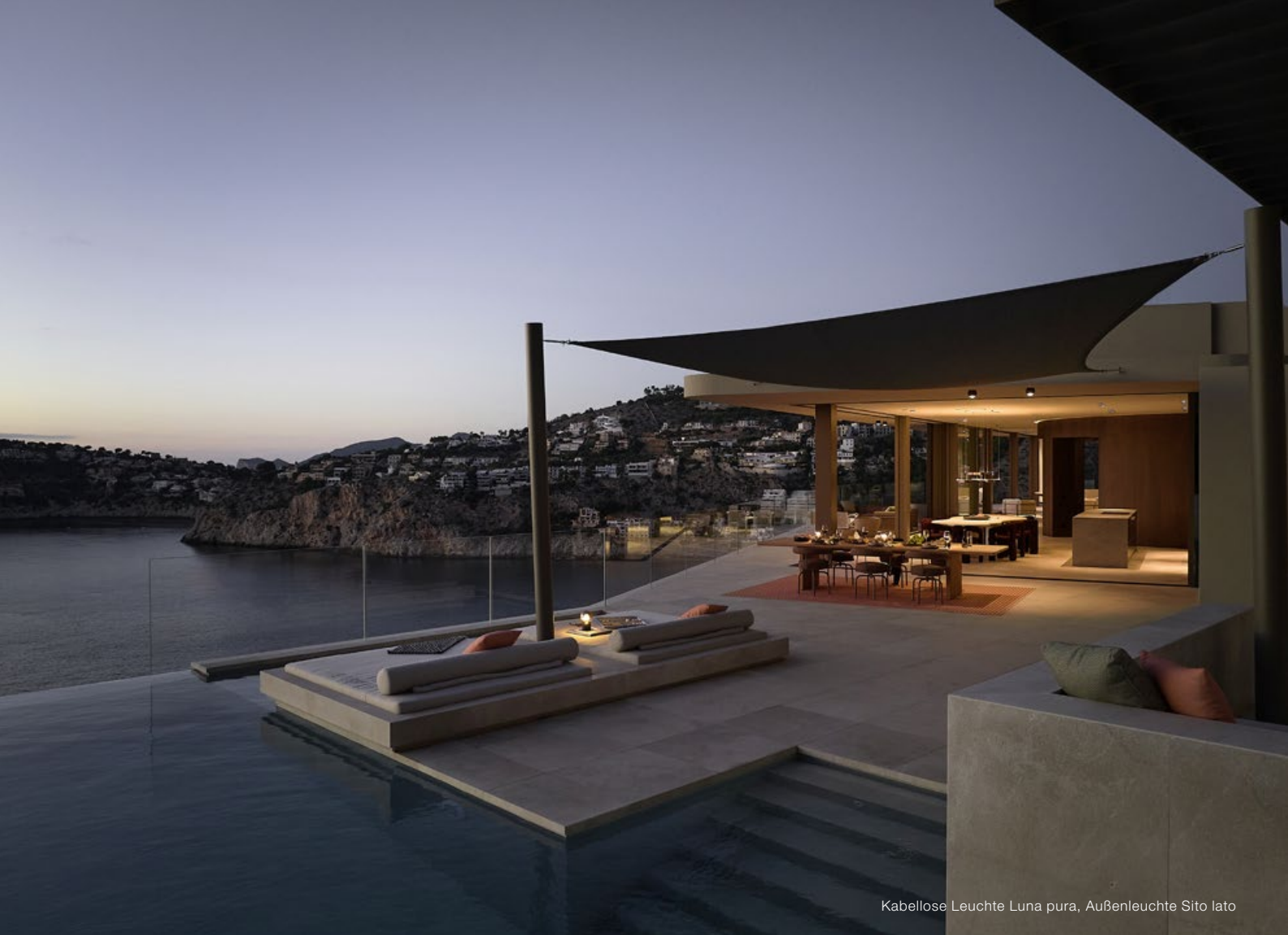
Kabellose Leuchte Luna pura, Außenleuchte Sito lato