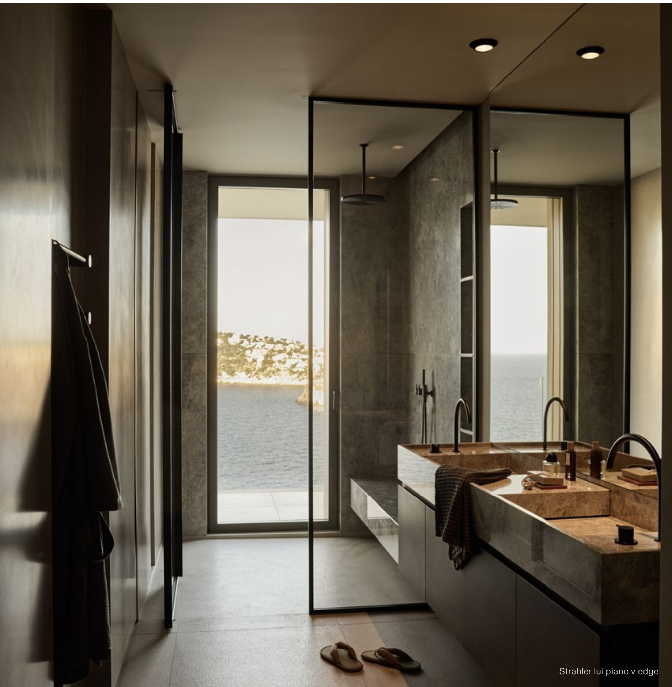
Strahler lui piano v edge

Drinne die Badlandschaft, draußen das Meer. Hier fließt der Raum über alle architektonischen Grenzen hinweg, begleitet vom Licht des Strahlers lui piano v edge, der die Tageslichtstimmung perfekt ergänzt.