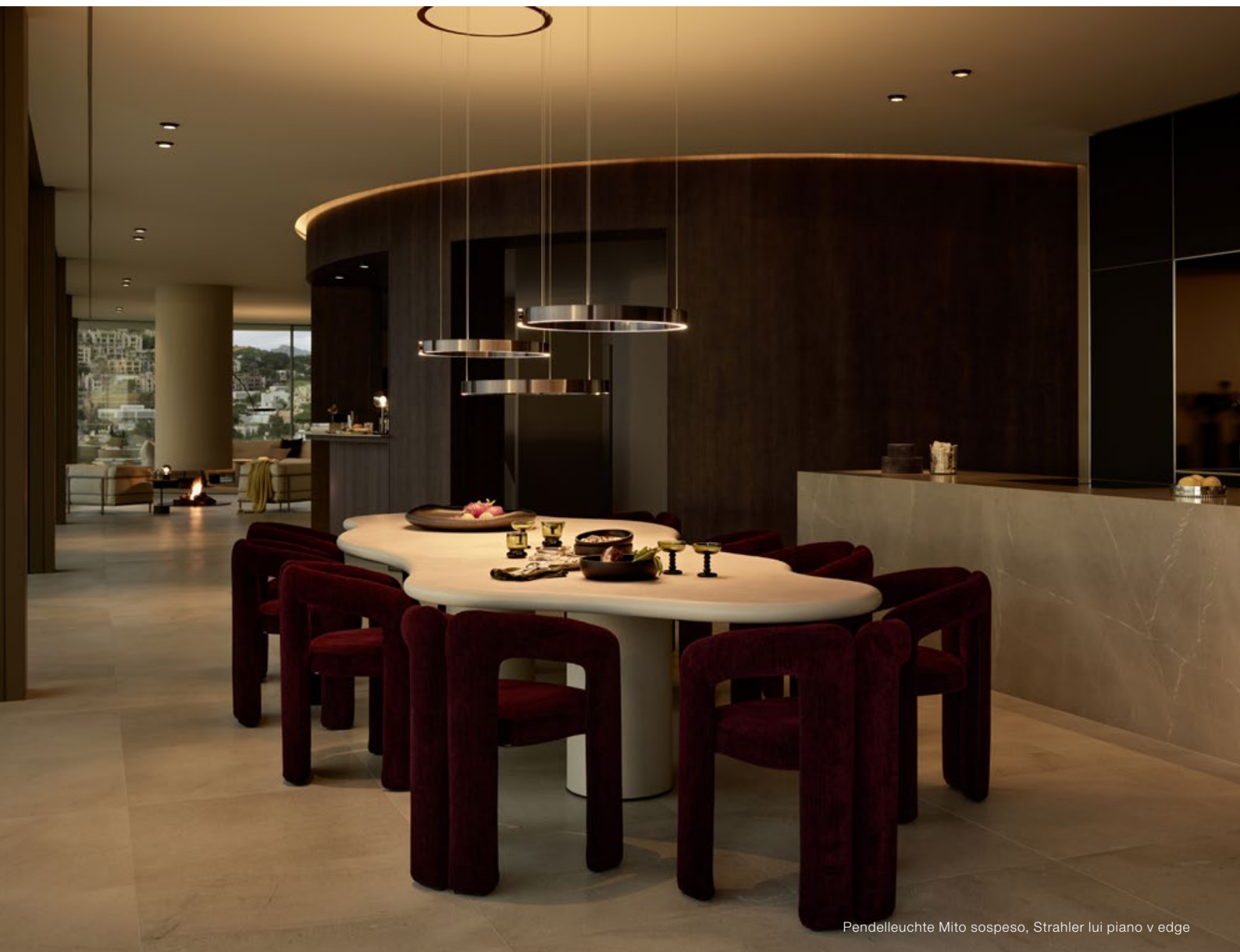
Pendelleuchte Mito sospeso, Strahler lui piano v edge

Die oberste Etage beherbergt den Wohn- und Essbereich mit eigener Bar, Showküche und repräsentativem Essplatz. Um diesen zu einem besonderen Highlight zu machen, wurden drei per Geste höhenverstellbare Mito cosmo move gewählt, die über dem Tisch angeordnet sind. Doch dies ist nicht der einzige Grund für diese Entscheidung: Die großzügigen Glasflächen dieser Ebene lassen sich komplett öffnen – so kann die Leuchte bei Wind komplett in die Decke zurückgefahren werden. Als Begleitung kommen Einbau-Downlights der Strahlerserie lui zum Einsatz, um einzelne Bereiche zu inszenieren und noch stärker hervorzuheben.