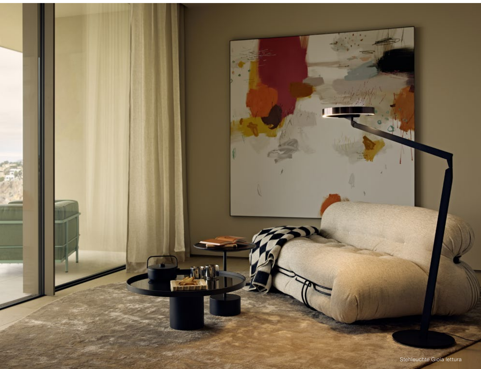
Stehleuchte Gioia lettura

Geselligkeit zum einen, Privatsphäre zum anderen: Direkt an die Master-Suite angeschlossen, befindet sich eine gemütliche Lounge, in die man sich zurückziehen kann. Auch von hier aus bietet sich ein fantastischer Blick über die Bucht, den man sich nicht entgehen lassen möchte. Neben dem Sofa sorgt die schwenkbare Stehleuchte Gioia lettura mit ihrem Focuslight für ideales Licht zum Lesen sowie für eine einladende Grundstimmung im gesamten Raum.